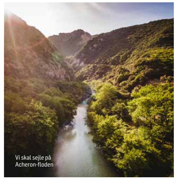
Vi skal sejle på Acheron-floden

All inclusive light Der er all inclusive light på hotellet, hvilket indbefatter en righoldig morgenmad, frokost og en varierende aftenbuffet med græske og internationale retter. Til frokost og aftensmad er der inkluderet vand, husets vin, øl og et udvalgt sortiment af soft drinks. www.maistro.gr